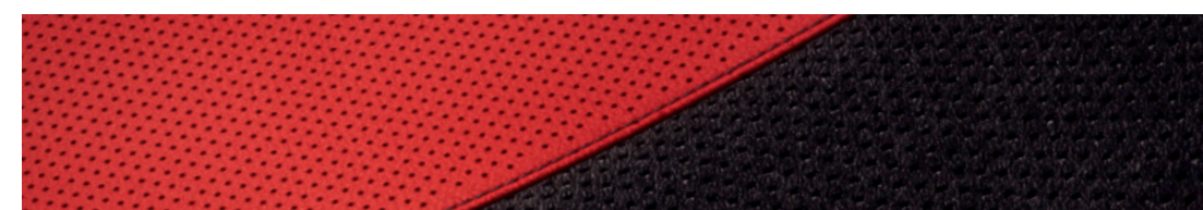
Cuir rouge avec insertion en Ultrasuede MD