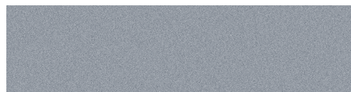
Argent lunaire métallisé